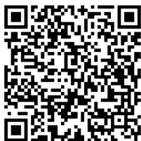
งานอาคารสถานที่